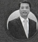
คุณสุริยะ จึงรุ่งเรืองกิจ รัฐมนตรีว่าการกระทรวงอุตสาหกรรม