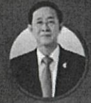
คุณฉายก เดิมพิทยาไพสิฐ รัฐมนตรีว่าการกระทรวงการคลัง