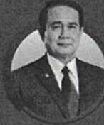
ปาฐกถาพิเศษ พลเอกประยุทธ์ จันทร์โอชา นายกรัฐมนตรี