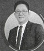
คุณเฉลิมชัย ศรีอ่อน รัฐมนตรีว่าการกระทรวงเกษตร และสหกรณ์

13.30 - 15.00 น. Next Normal Agriculture