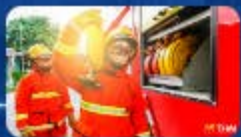
คลิกรูปภาพเข้าสู่ระบบ ดับเพลิง ภาคราชการ