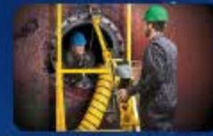
คลิกรูปภาพเข้าสู่ระบบ ฝักอบรมอันอากาศ