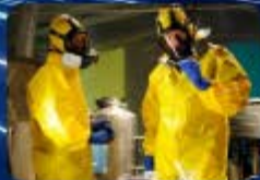
คลิกรูปภาพเข้าสู่ระบบ ตรวจวัดสารเคมี