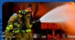
คลิกรูปภาพเข้าสู่ระบบ ดับเพลิง ภาคเอกชน