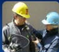
คลิกรูปภาพเข้าสู่ระบบ ตรวจวัด/ตรวจวิเคราะห์สารเคมี