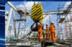
คลิกรูปภาพเข้าสู่ระบบ ทดสอบเครื่องจักร ปั้นจั่น หม้อน้ำ