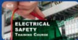
คลิกรูปภาพเข้าสู่ระบบ ฝักอบรมไฟฟ้า