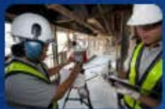
คลิกรูปภาพเข้าสู่ระบบ ตรวจวัดความร้อน แสงสว่าง เสียง