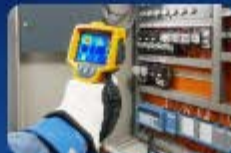
คลิกรูปภาพเข้าสู่ระบบ ตรวจสอบไฟฟ้า