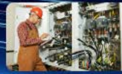
คลิกรูปภาพเข้าสู่ระบบ ตรวจสอบไฟฟ้า