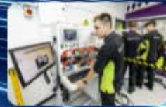
คลิกรูปภาพเข้าสู่ระบบ ฝักอบรมไฟฟ้า