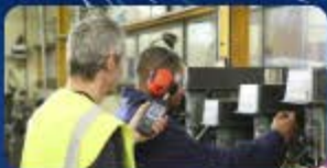
คลิกรูปภาพเข้าสู่ระบบ ตรวจวัดและวิเคราะห์ความร้อน แสงสว่าง เสียง