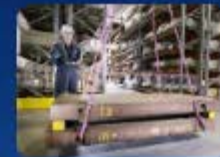
คลิกรูปภาพเข้าสู่ระบบ ทดสอบเครื่องจักร ปั้นจั่น หม้อน้ำ