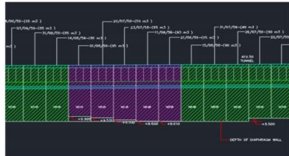
รูปภาพที่ 1-6 แสดงแบบผนังพืด ( DIAPHRAGM WALL ) ที่จุดเจาะไม่ถึงระดับที่ออกแบบไว้

* แก้ไขปัญหาโดยส่งข้อมูลให้ผู้ออกแบบ ผู้ออกแบบเสริมกำลังของผนังพืดใหม่โดยเพิ่มเหล็กชั้นของผนังพืดให้มากขึ้นกว่าที่ออกแบบไว้เดิม