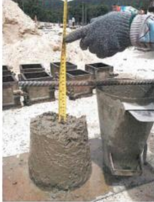
3. งานเก็บตัวอย่างคอนกรีต