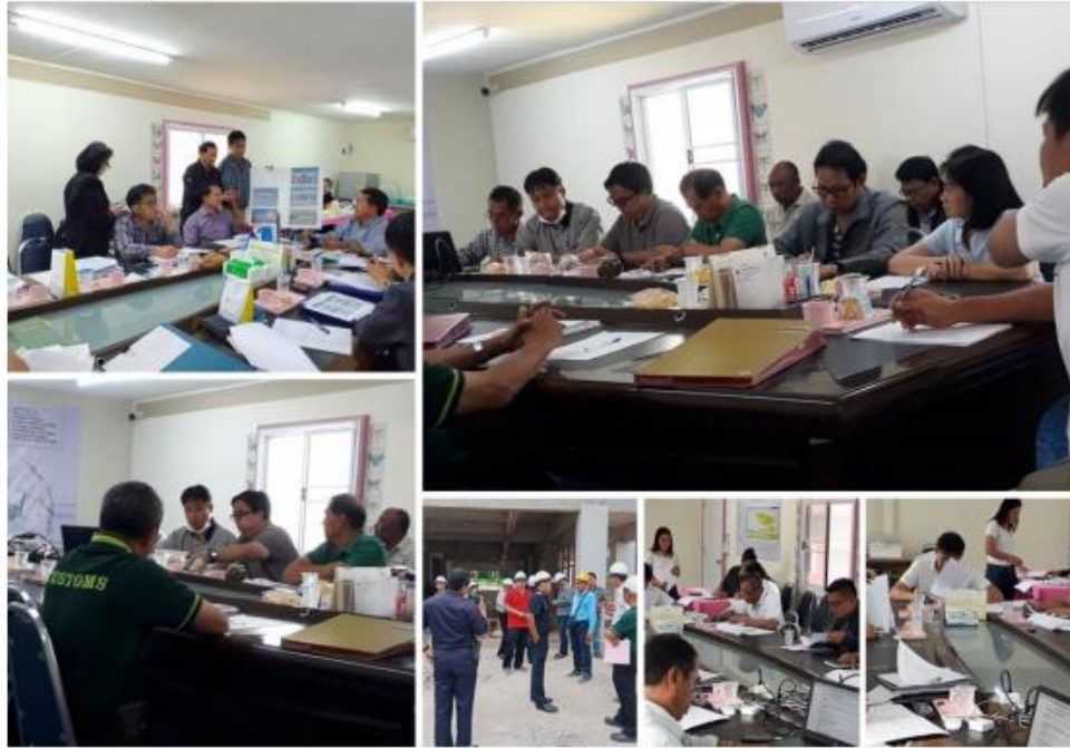
17. ประชุม ตรวจสอบ