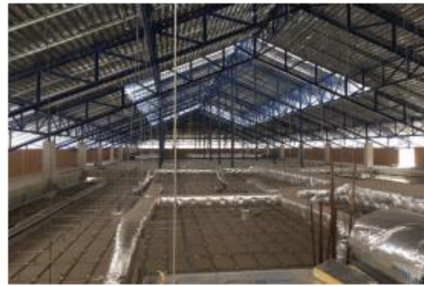
11. งานมุงหลังคา