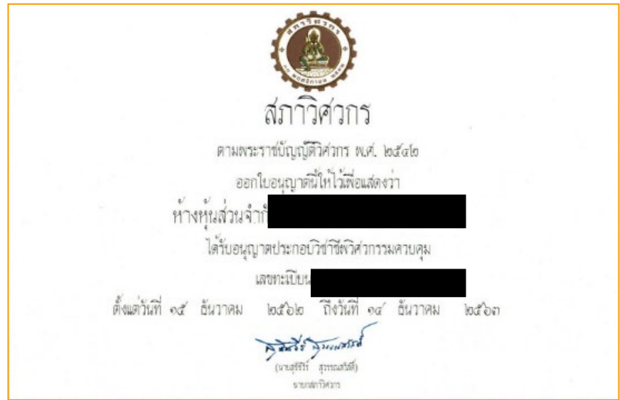
ตัวอย่าง ใบอนุญาตประกอบวิชาชีพวิศวกรรม ควบคุม ประเภทนิติบุคคล

ใบอนุญาตที่ออกโดยสภาวิศวกร เพื่อให้สิทธิในการประกอบวิชาชีพวิศวกรรมควบคุม >> สิทธิ + หน้าที่ + ความคุ้มครอง