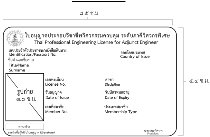
(รูปขยายด้านหน้า)